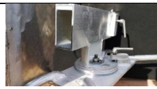
dreieskive med rigg feste

Alle maskiner leveres uten dreieskive. Dreieskiven med lås og plate for å sveise fast oppheng til rigg leveres som tilleggsutstyr.