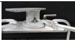
dreieskive m sveiseplate

Alle maskiner leveres uten dreieskive. Dreieskiven med lås og plate for å sveise fast oppheng til rigg leveres som tilleggsutstyr.